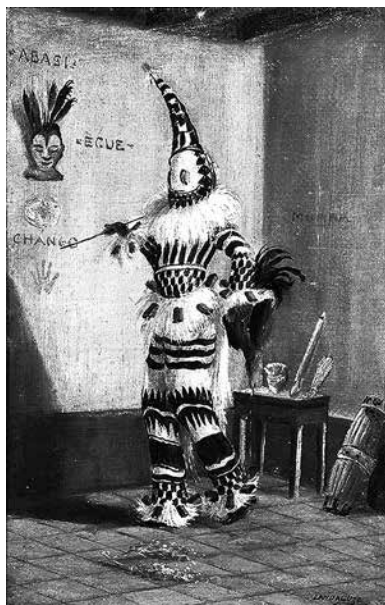
Imagen 2b. "Diablo Mongo" (Landaluze 1880 [abakuâ]).