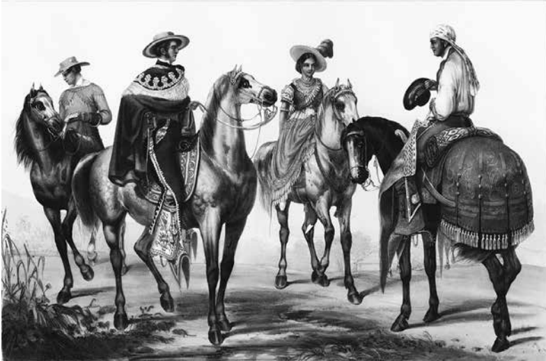
Imagen 1a. Chinacos/charros en México. "El hacendado y su mayordomo" (Nebel 1834).