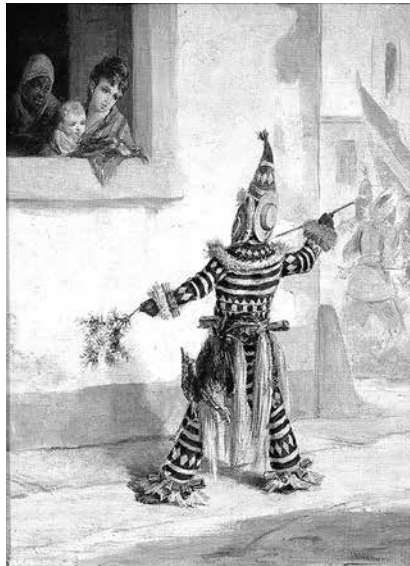
Imagen 2a. “Diablito” (Landaluze 1880 [abakuá]).

La Habana y de otras ciudades de Cuba. Pero también había un grupo más amplio con estas habilidades: los que llegaron como esclavos desde África, que ya dominaban la escritura alfabética latina. Este fue muchas veces el caso de las personas procedentes del pueblo efik, en la región de Cross River entre las actuales Nigeria y Camerún; así como de los ambakistas (ambaquistas) o ambacas de las regiones de Congo y Angola, que eran traficantes de esclavos africanos del pueblo de Ambaca. Como esclavistas y comerciantes muy activos en África, los efik interactuaron primero con los portugueses y, a partir del siglo XVIII, con los traficantes de esclavos y capitanes de barcos de esclavos europeos, ingleses, cubano-españoles y norteamericanos, sobre todo de habla inglesa; los ambaquistas principalmente con luso-africanos y portugueses (Vansina 2005; ver también Caldeira 2014, 2015; Heintze 2002, 2013). Como esclavos, los individuos de habla portuguesa eran llamados ladinos . De manera similar a todas las sociedades y regímenes esclavistas, los traficantes de esclavos también vivían peligrosamente: algunos fueron también esclavizados y se vieron obligados a migrar a través del Atlántico como “mercancías parlantes”.