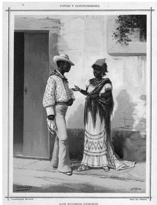
Imagen 1b. En Cuba. "Los negros curros" (Landaluze 1881).